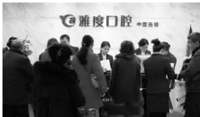
德系口腔种植牙速度和品质深受市民好评

免不了对患者造成一定创伤,而这项种植牙优势在于快速、微创、微痛,因为不需要翻开牙龈反复观察,环切牙龈后,直接在牙槽骨上制备孔洞,然后植入种植体即可,不仅出血量少,无需缝合而且术后不容易肿胀。因此,非常适用于即拔即种手术。既节省了费用,又提高了种牙速度,降低了创伤,非常适合牙齿松动、有残缺牙市民。