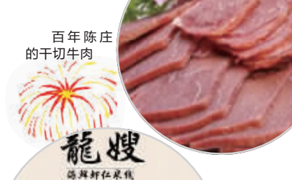
百年陈庄的干切牛肉