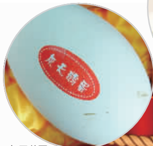
灰天鹅蛋