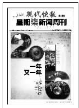
上期星期柒新闻周刊封面