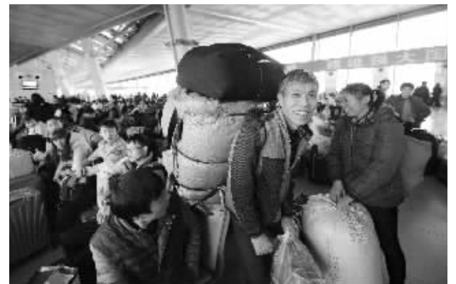
不少人已经踏上回家路