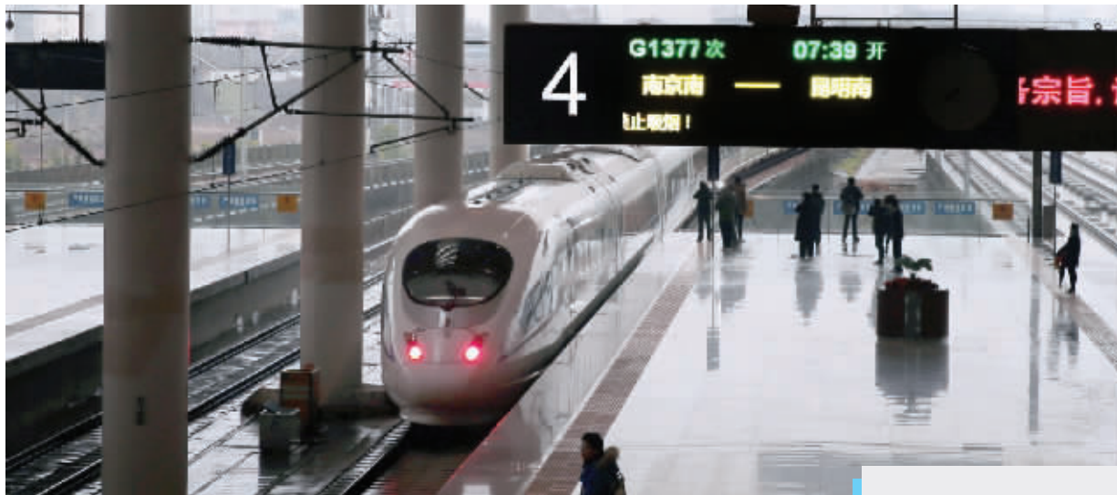
1月5日,南京南站高铁G1377次驶出,这是南京到昆明的首趟高铁