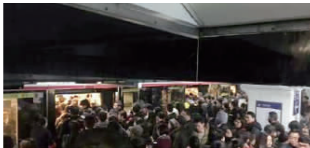
事故发生后南京地铁2号线一度人满为患