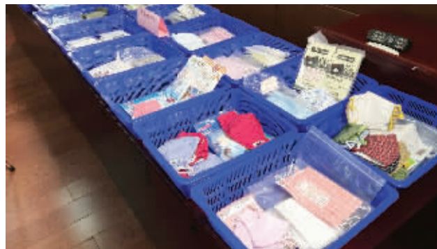
存在质量问题的口罩

“40款口罩,真正防霾的只有2款”“明星同款,防霾不如5毛医务口罩”……你是不是也被这些消息惊到了?口罩到底应该怎么选?12月29日上午,江苏省质监局发布2016年口罩产品风险监测质量分析报告,160批次口罩产品,只有61批次符合口罩新国标,合格率为38%。