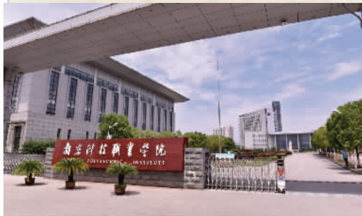
南京科技职业学院外景

今年是学校开展家书活动的第六年,又有3100多名大一新生给家里写了书信。学校关工委根据学生自愿原则,回收了160多封书信,写得非常感人。“我们会把这项活动传承下去,让学生在网络时代,在通信便捷的今天,静下心来,好好想一想,写一写。”