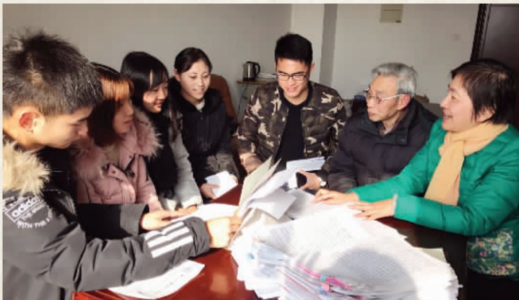
南京科技职业学院关工委的老师跟学生们谈心

但上了大学之后,渐渐懂事。书信这样的表达方式,让她找到了表达情感的载体。信中她写道:“不知不觉回想起以前的日子,心里渴望离家……在陌生的宿舍楼下,你们与我告别,我才真正意识到,自己离开了你们的羽翼。而奇怪的是,我并没有想象中那样快乐。目送着你们开车远去,我的眼睛一阵酸痛。一封信无法表达我心中的所有感受,但我需要让你们知道:我很想也很爱你们……”