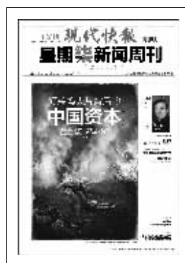
上期星期柒新闻周刊封面