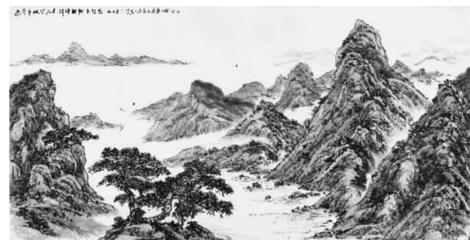
覃志刚《过尽干帆皆不是，斜晖脉脉水悠悠》123cm×250cm