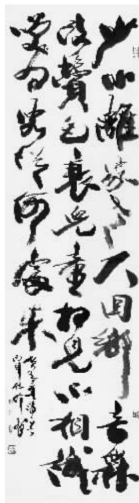
韩天衡《贺知章·回乡偶书》350cm×190cm