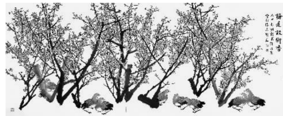
郁钧剑《梅是故乡香》133cm×325cm