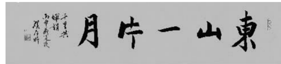
濮存昕《楷书·东山一片月》31cm×138cm