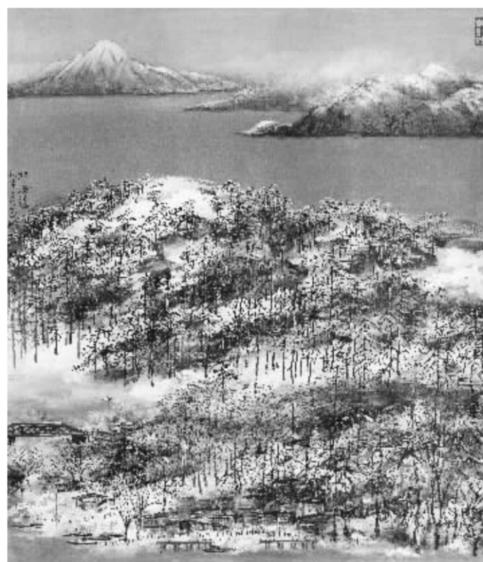
宋玉明《日本北海道》80cm×70cm