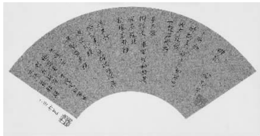
余光中《扇面·乡愁诗一首》46cm×69cm