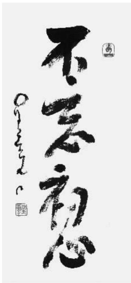
星云大师《不忘初心》90cm×42cm(特邀)

“江山留胜迹，我辈复登临。我们衷心希望所有江苏籍在外和在家的艺术家们，在前人奠定的文化高原上，不忘初心，继续前进，不辱使命，创作更多更好的艺术精品之作、经典之作，用艺术作品构建艺术高峰，为中华民族的伟大复兴贡献江苏才智、江苏力量！”章剑华说。