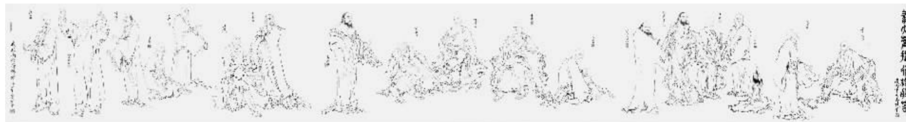
范曾《画大善提行深般若》60cm×463cm