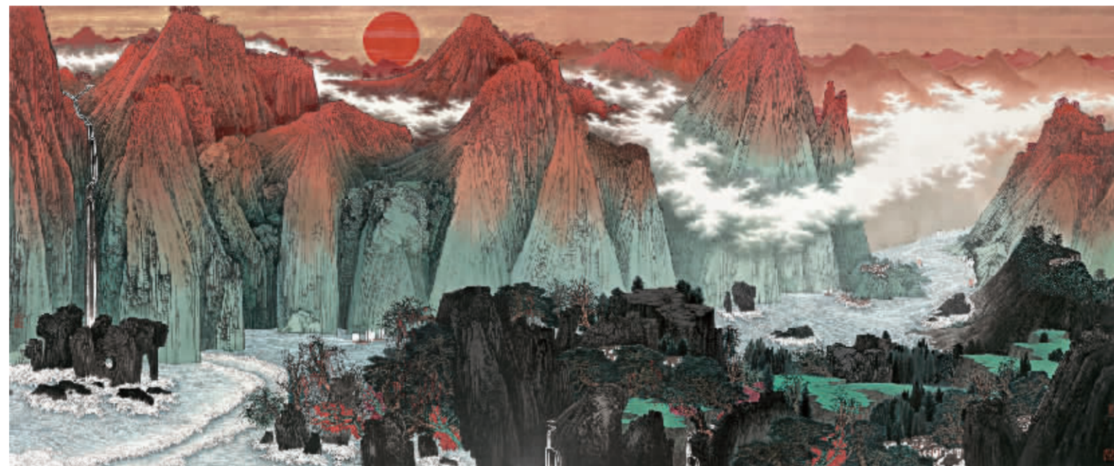
《长风破浪会有时 直挂云帆济沧海》