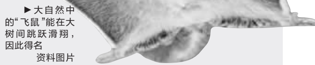
▶ 大自然中的“飞鼠”能在大树间跳跃滑翔,因此得名 资料图片

就在几天前,张某因涉嫌非法出售珍稀濒危野生动物罪被武进检察院依法提起公诉。办案检察官提醒,不仅仅是高冠变色龙,其他品种的变色龙也同样被列入《濒危野生动植物种国际贸易公约》,属于国家重点保护的珍稀濒危野生动物。也正因此,买卖变色龙都是违法的。