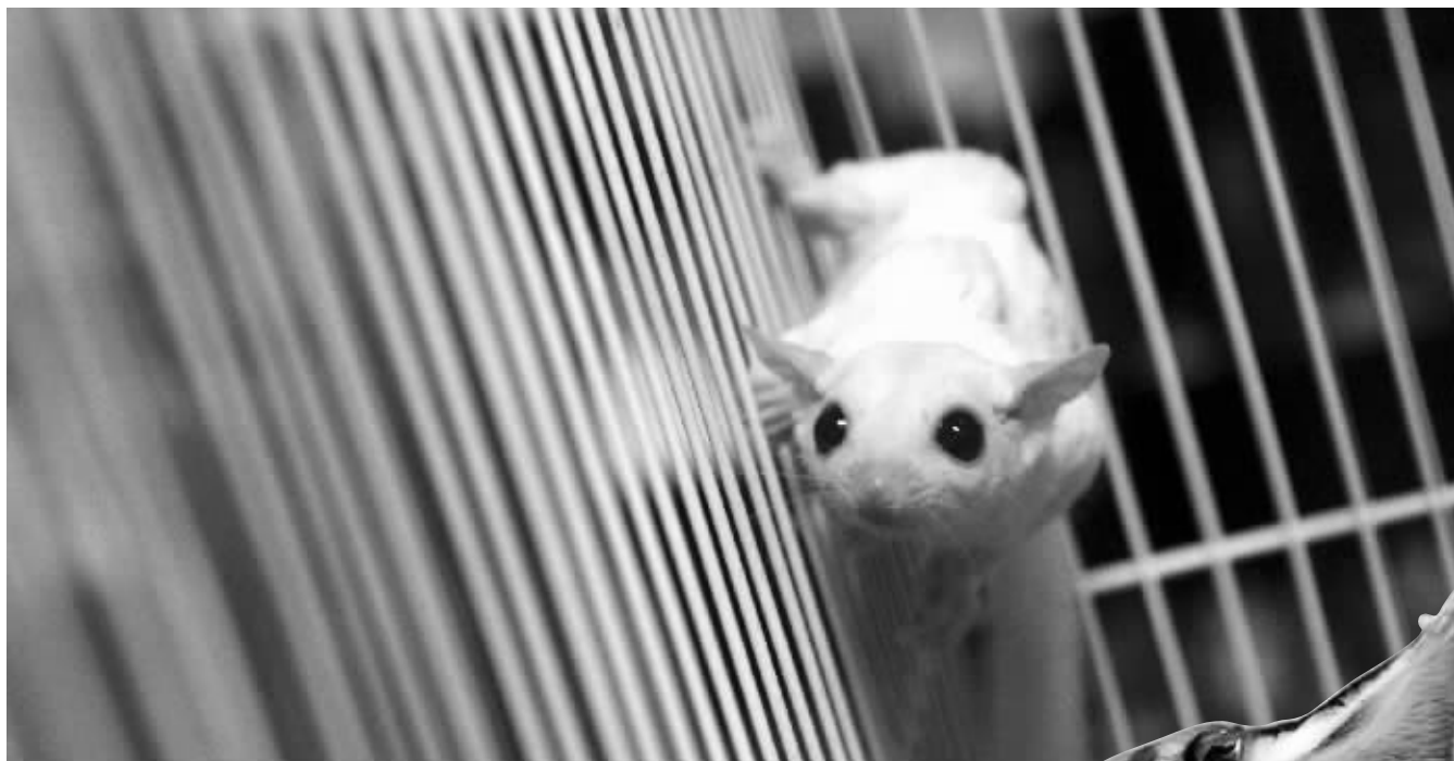
小宇买的“飞鼠”在笼中活蹦乱跳挺可爱