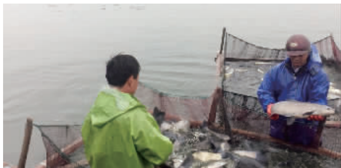
甘露青鱼昨天正式开捕

以往市场上常会有不少山寨甘露青鱼,让不少消费者上当。今年,为了避免这种情况发生,水产协会为每一条进入市场的甘露青鱼量身定制了一个二维码,市民在购买时,可通过智能手机扫描二维码,获取这条青鱼的种苗来源、饲养情况、上市时间、养殖地点等信息,避免买到“山寨货”。