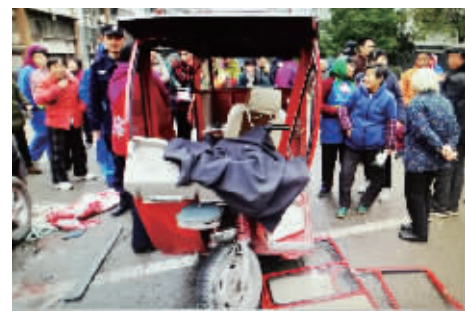
被撞的三轮马自达