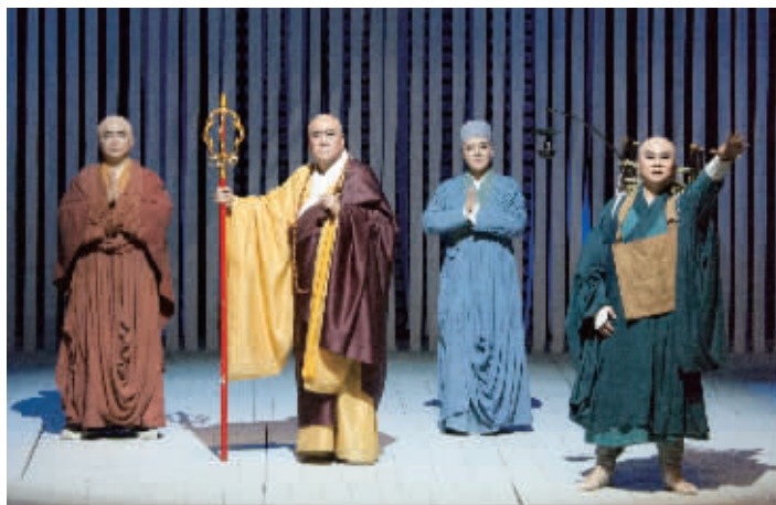
江苏原创歌剧《鉴真东渡》剧照