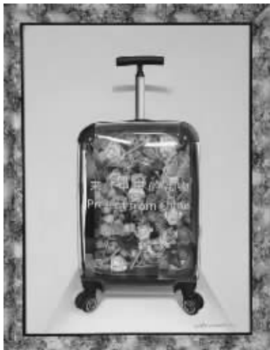
江恒 来自中国的礼物之三 170X140cm 2016 中国