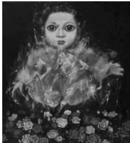
Luu Tuyen 复活2 布面油画 120X110cm 2014 越南

近年来,随着亚洲地区文化影响力的不断增长,亚洲在当下艺术领域的分量也越来越重,这背后依托的是亚洲文化丰富、多元的深厚传统和在现代化的过程中日益深入的对话、交流,亚洲的艺术也因此呈现传统与现代、固守与融合、排斥与包容的复杂又多样的面貌。