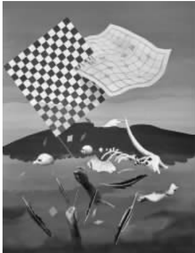
龙田诗 强拉下沉 150X114cm 2016 马来西亚