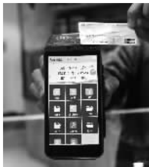
将未开通闪付功能的“二合一”卡靠近POS机