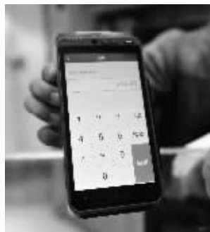
在POS机上输入金额20元