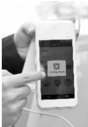
POS机不支持闪付,操作失败