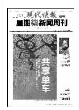
上期星期柒新闻周刊封面