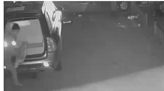
监控拍下了猪肉被盗的画面 警方供图

快报讯(通讯员 秦公轩 丁筱蒙 记者 陶维洲)凌晨,南京猪肉贩子老吴进了几斤生猪肉拖到菜场。因为一斤生猪肉有90多斤重,所以他只能一斤斤往菜场里拖。结果,等他送完一斤猪肉回到车前时,发现猪肉少了一斤。警方调看监控发现,有个“大力士”小偷,一个人抱走了一斤猪肉。