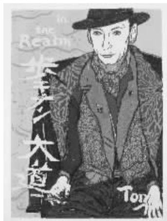
【丹麦】Knud Odde Sorensen作品