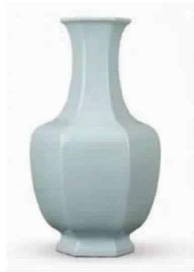
乾隆天蓝釉六方瓶