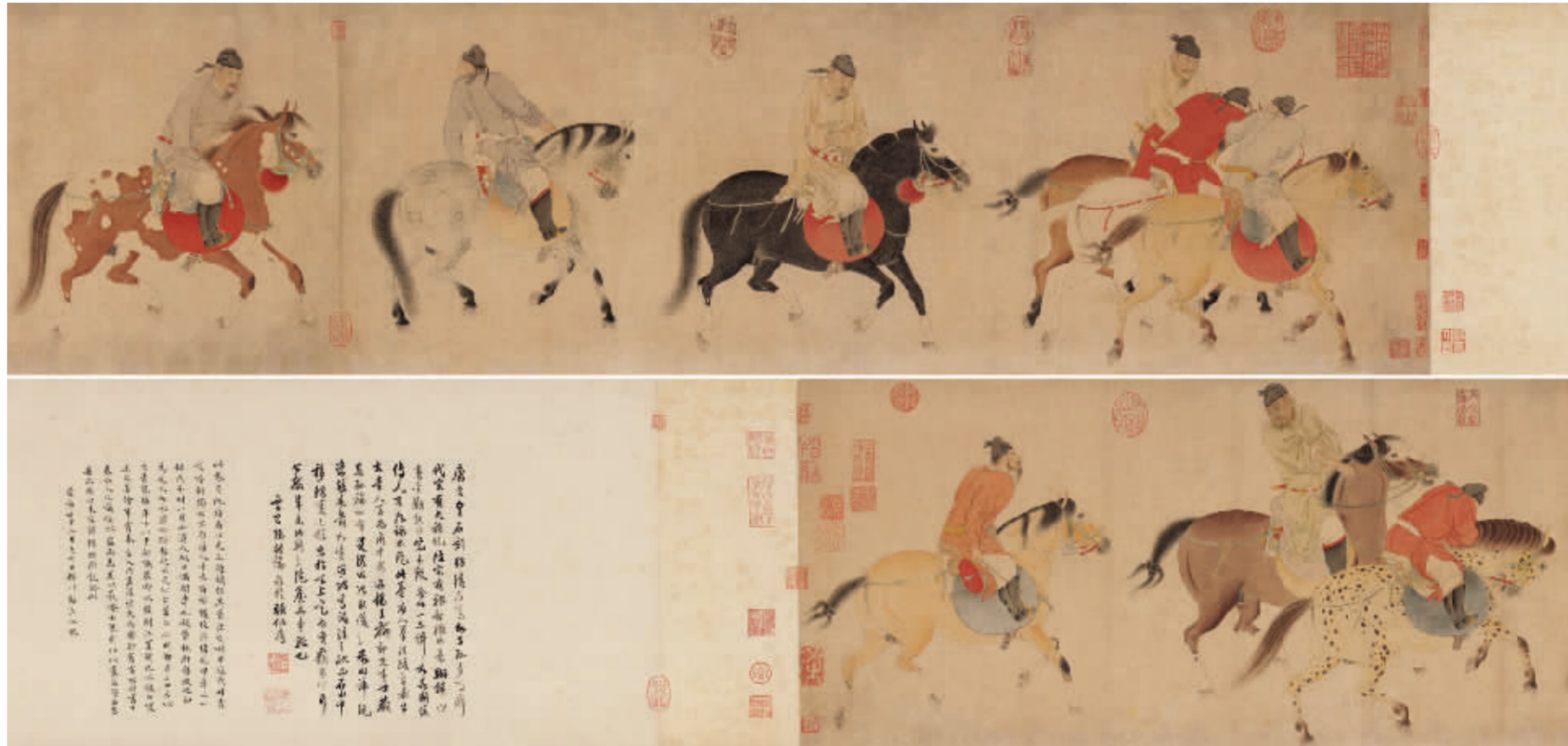
任仁发 五王醉归图卷