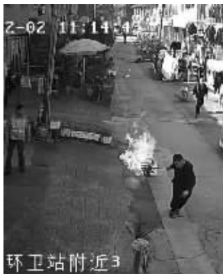
▲摄像监控记录下的救火场景