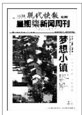
上期星期柒新闻周刊封面