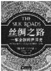
2016年10月 浙江大学出版社 [英]彼得·弗兰科潘 《丝绸之路》 历史

本书中,埃科旁征博引,把饶有兴味的研究目光放在了人类史上“制造和定义敌人”的根源与过程。我们如何定义和对待“与我们不同的人”?这些不同的人如何会成为我们的敌人?我们又应当如何面对敌人,有没有尝试和解的可能?