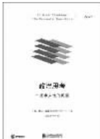
2016年9月 北京联合出版公司 [美]格伦·廷德 《政治思考:一些永久性的问题》 政治

丝绸之路让中国的丝绸和文明风靡全球。罗马和波斯在路边缔造了各自的帝国。佛教、基督教和伊斯兰教沿着丝绸之路迅速崛起并传遍世界,融会出耶路撒冷三千年的历史。成吉思汗的蒙古铁蹄一路向西,在征服的同时促进了东西方文明的交融。大英帝国通过搜刮丝绸之路上的财富,铸就了日不落的光辉,时至今日,丝绸之路上的难民与恐怖组织ISIS,依然是欧洲与美国挥之不去的魔影……丝绸之路不仅塑造了人类的过去,更将主宰世界的未来。本书以“丝绸之路”为切入点,为我们呈现了一幅浓缩的世界史画卷。