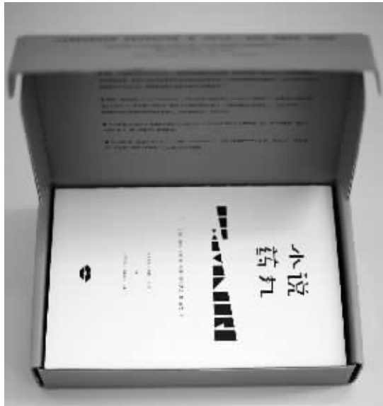
《小说药丸》 [英]埃拉·伯绍德、苏珊·埃尔德金 上海人民出版社2016年9月