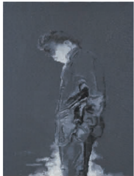
2010 沉思者1 80cm x 60cm 布面油画