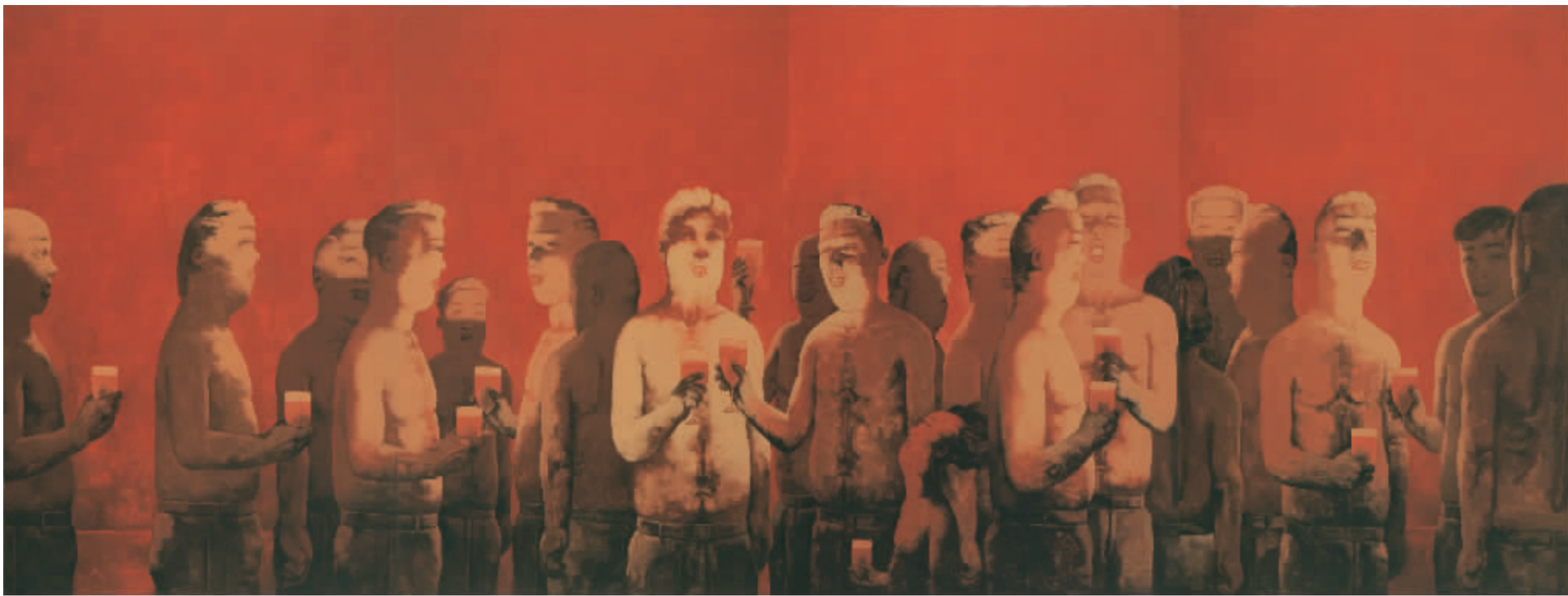
2006 干杯34号 300cm x 800cm 布面油画