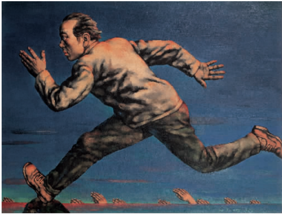
1997 欲望之海12号 97cm x 130cm 布面油画