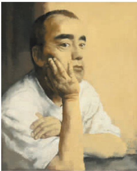
2005 无题1号 80cm x 65cm 布面油画