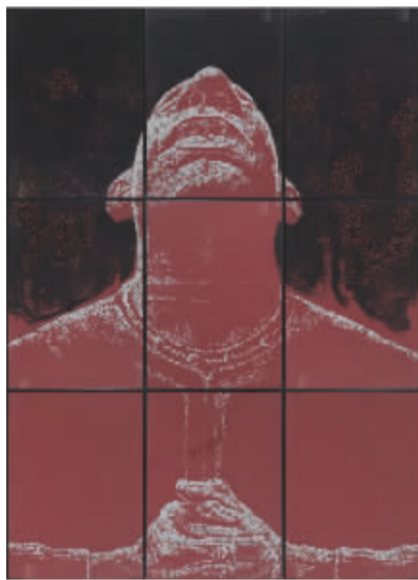
2004 肖像1号 330cm x 240cm 纸本素描