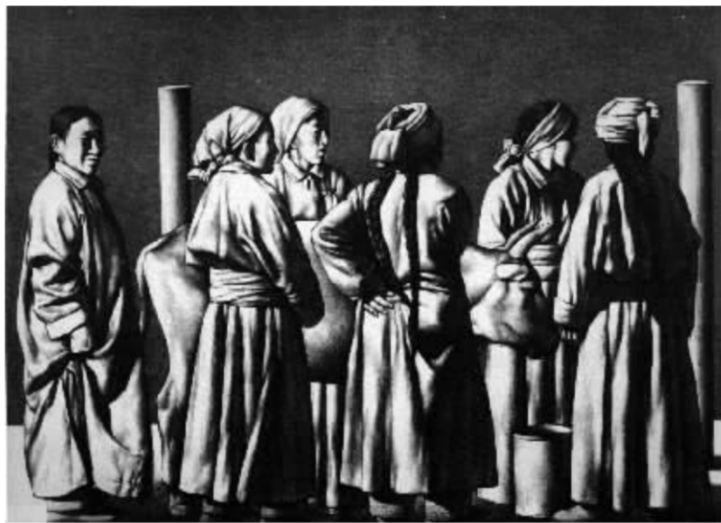
1988 女人与牛 51cm x 69cm 石版