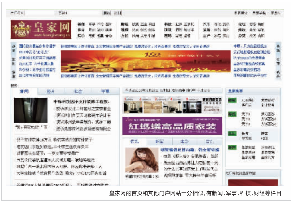
皇家网的首页和其他门户网站十分相似,有新闻、军事、科技、财经等栏目