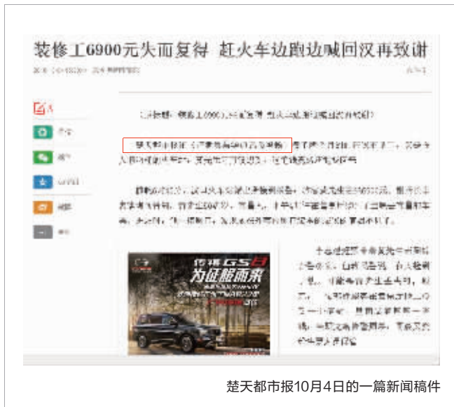
楚天都市报10月4日的一篇新闻稿件

他说,自己在21日下午5点半,联系了皇家网,要求对方撤稿,但对方只是让他把相关的文章标题留下,没有其他表示。“到现在我还能在他们网站上看到我的文章。”他称,接下来将不排除使用法律手段,维护自身和报社的合法权益。