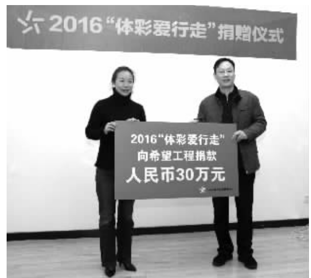
第二季“体彩爱行走”捐赠仪式

2016年11月23日下午,第二季“体彩爱行走”活动举行了“体彩爱心基金”捐赠仪式,江苏体彩现场将30万元“体彩爱心基金”捐赠给江苏省希望工程办公室,用于江苏体彩希望小学电脑教室建设。