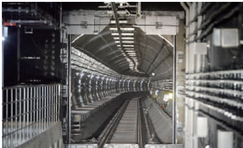
4号线全线设置疏散平台