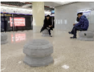
鼓楼站的柱础石凳