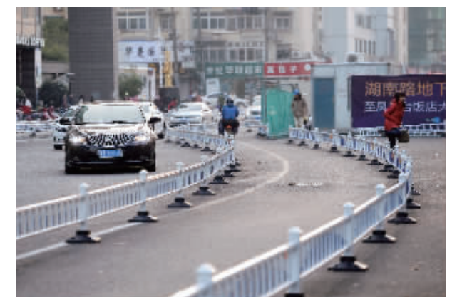
施工中的湖南路,目前“有限开放”了南半幅

“地面施工不仅影响交通,施工难度也比较大,因为涉及很多管线,会影响周边居民生活。”开发单位东方大唐置业有限公司相关负责人表示,“到明年四月份,地面工程结束,北半幅路面恢复通行,地下的弱电、自来水、煤气、下水等管线也会同步恢复。工程转入地下施工,留十个左右的出口用于渣土、材料、设备进出通道,对市民的影响就小了。”