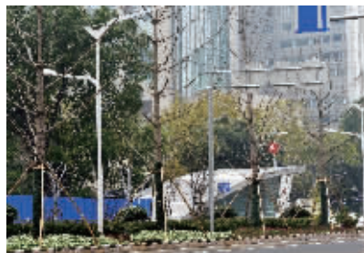
云南路站外恢复的银杏树