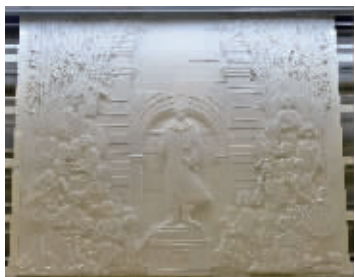
云南路站文化墙主角之一陶行知