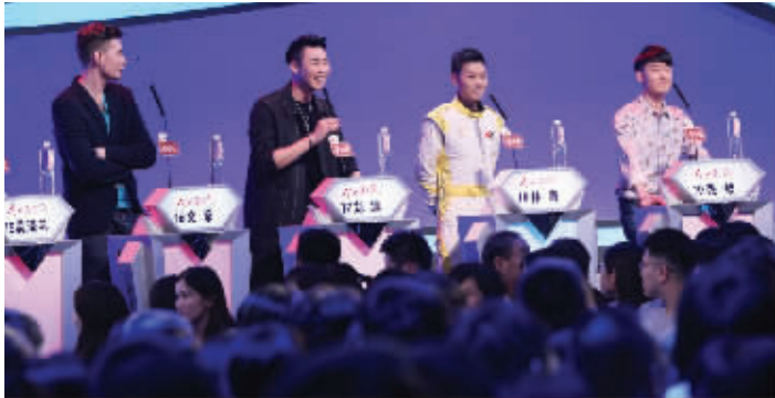
《缘来非诚勿扰》将升级为1女对24男的“女选男”模式