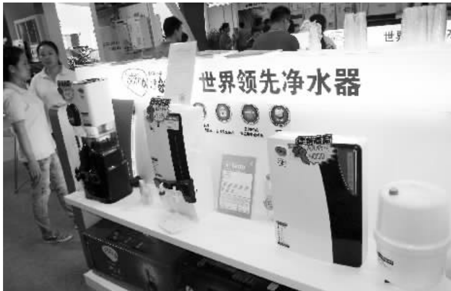
南京一家卖场的净水器柜台

注意了!如果在小区里看到类似这种“免费安装净水器”的通知,一定要留个心眼