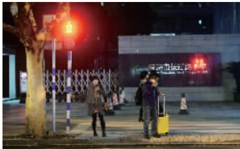
没人按过街按钮时,控制人行道的灯一直是红色