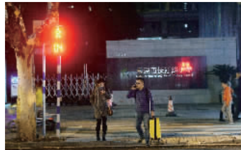
按下过街按钮,红灯会显示倒计时,随后会亮起绿灯

根据网上的说法,不仅电梯按钮,就连人行道上的过街按钮也只是一种安慰,在一些地区,交通高峰期过街按钮根本不会起作用,仍会按照红绿灯原来的计时走,只有在车少的时候,才会起作用。