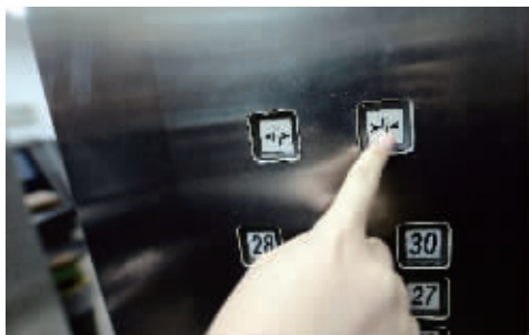
当按住电梯关门按钮时,电梯门会立即关闭