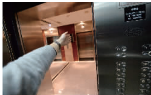
电梯门中间有物体时,电梯门是不会关上的

不少人曾怀疑:电梯有自己的关门时间,不管按不按关闭按钮,过个三五秒,电梯都会自动关门。有网友援引报道说,上世纪90年代,美国大部分电梯里的“关门”按钮就已经被淘汰了。但是由于大家渴望在日常生活中找到一种自我行动意识,制造商们才加上这个按钮。所以,不管你有多么迫切地想要关上电梯门,电梯依旧会按照设置好的时间来关门。而设置的原因是,确保残疾人有足够的时间进入电梯。