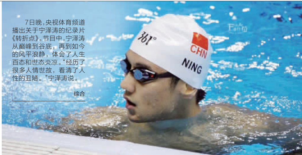
宁泽涛暗示将退役?

7日晚,央视体育频道播出关于宁泽涛的纪录片《转折点》。节目中,宁泽涛从巅峰到谷底,再到如今的风平浪静,体会了人生百态和世态炎凉。“经历了很多人情世故,看清了人性的丑陋。”宁泽涛说。