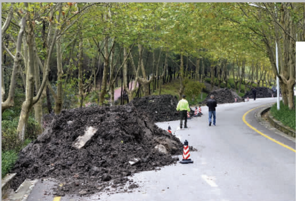
偷倒在陵东路上的渣土

昨天早上7点半左右,中山陵园管理局的工作人员在巡查时发现,有人于前一天夜里,在钟山体育馆北侧的陵东路上,偷偷倾倒了6大堆渣土,每堆都有一人高、约50吨重。目前,他们正和交警部门一起通过监控,查找相关车辆。