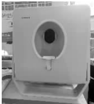
中医远程诊疗设备