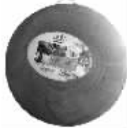
泰国“金檀木”圆形砧板