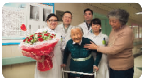
102岁老人手术后出院