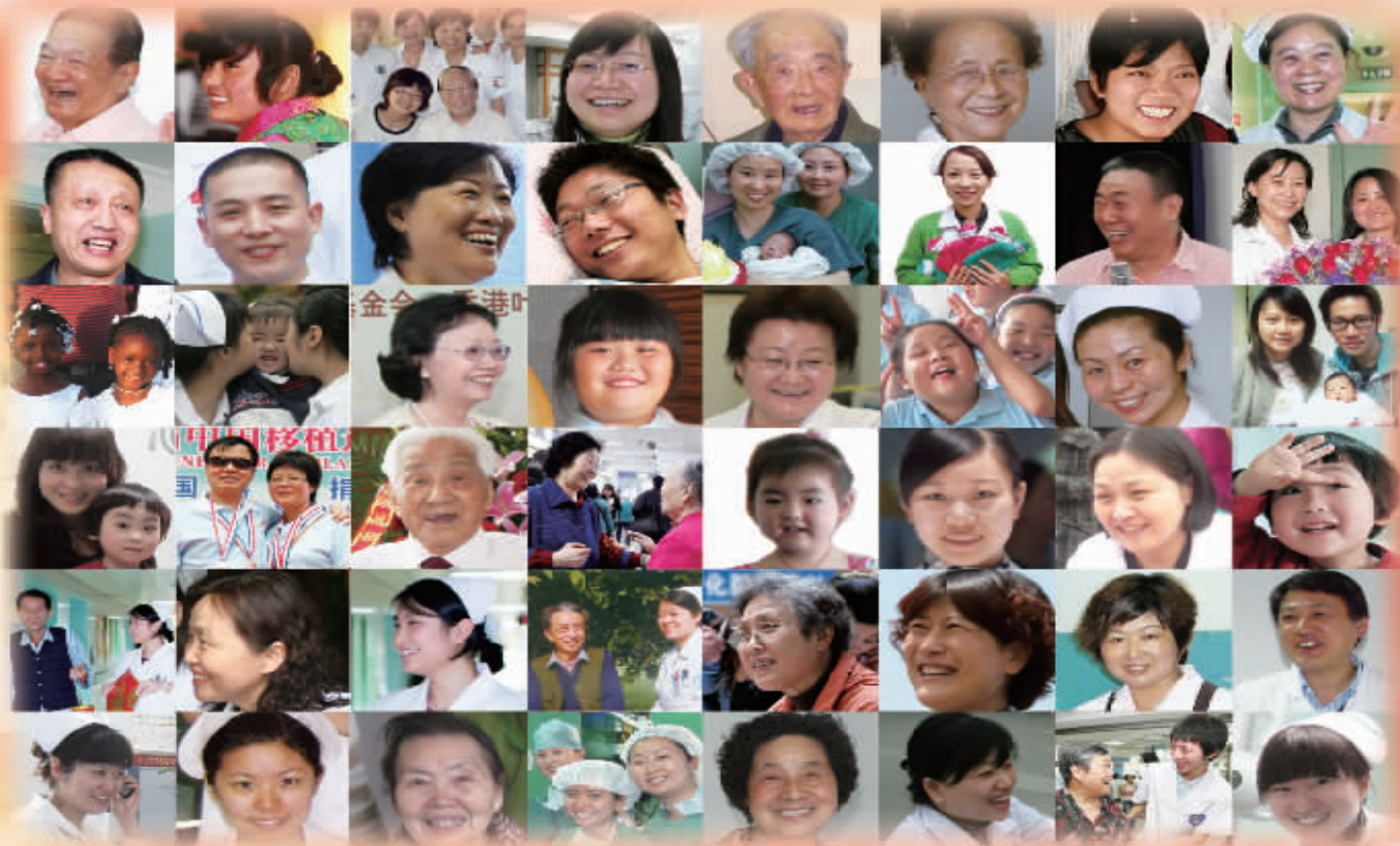
一张张笑脸的背后诉说着一个个温暖和饱含着爱心的故事