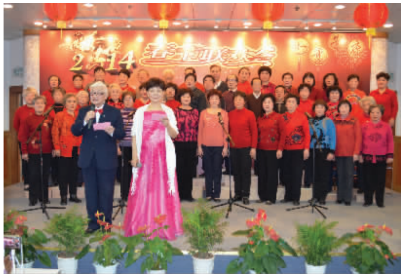
丰富多彩的职工活动