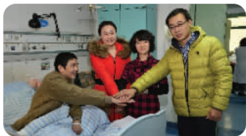
路边救人的“红衣少女”和患者及家人在一起