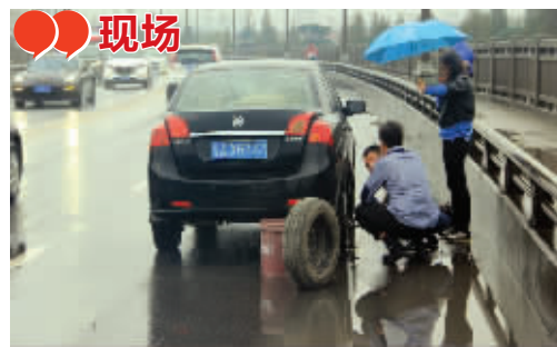
车辆爆胎现场