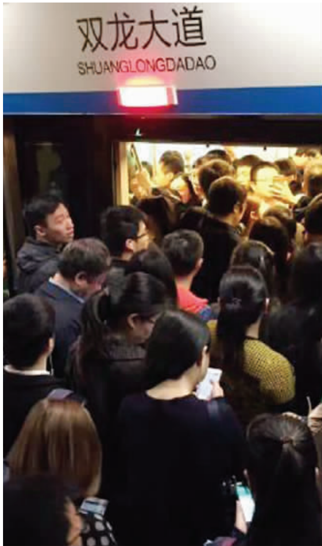
地铁1号线“趴窝”,乘客积压站内 请图片拍摄者联系我们领稿费

点设备机房加派驻点人手,强化应急处置。三是根据1号线信号系统运行现状,联合设备供应商、设计单位开展性能评估,并着手准备1号线信号系统后续的更新改造工作。