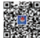
关注“南京消防”参与投票

市民可通过关注“南京消防”微信公众号,进入公众号点击下方的投票选项进行投票。投票从10月27日开始,将持续至11月7日。