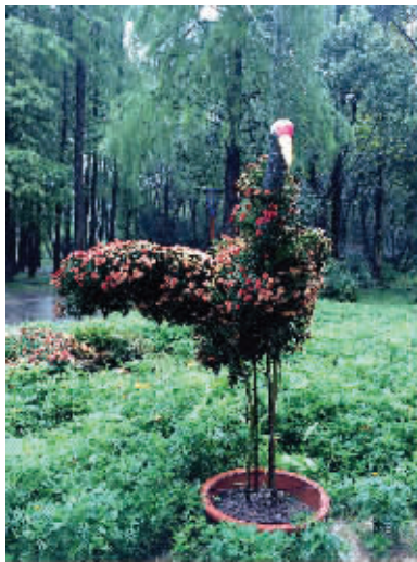
身穿菊花衣的“孔雀”

快报讯(通讯员 田松沪 记者 俞月花)穿着菊花衣裳的“孔雀”“白天鹅”,在淅淅沥沥的秋雨中,显得格外动人!现代快报记者获悉,南京中山植物园正在举办近万盆菊花展。其中,有大立菊、塔菊、盘龙菊、球菊、树菊等各式菊花造型在园中争奇斗艳。深受小朋友们喜爱的“孔雀”,穿着花衣裳,在雨中傲娇地“开屏”啦!别有一番情趣!