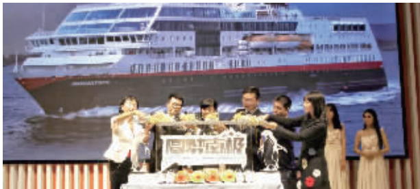
同程旅游“圆梦南极”邮轮即将启航

昨天,“圆梦南极”2016同程旅游南极邮轮包船首航盛典在苏州同程大厦隆重召开。现场,同程旅游宣布,同程旅游“圆梦南极”邮轮将于11月11日正式起航,由此拉开高端邮轮旅游产品的序幕。