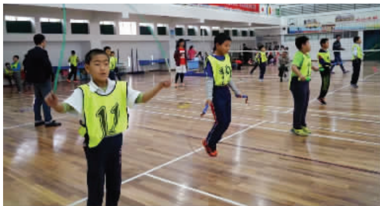
学生们在跳绳测试中表现不错

快报讯(通讯员 许小娟 蔡敏捷 记者 黄艳)现代快报记者昨天从南京教育部门获悉,本周国家教育部《国家体质健康标准》测试抽查复核工作南京站启动,南京市玄武区、六合区共有8所中小学接受了由教育部委派的第三方机构的体质测试。目前南京学生的表现得到测试方的肯定,有小学把跳绳当作家庭作业,在测试中表现出色。