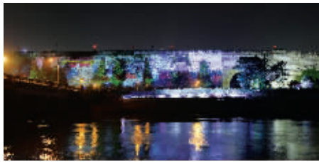
中华门、秦淮河夜景