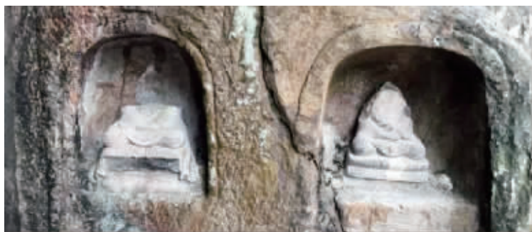
法国汉学家维克多·谢阁兰20世纪20年代拍摄的照片(上)揭开了一个秘密

“跋马崩岩(zé lì)间,周旋多石佛。峰回路转处,满月殊不一。化身岂无谓,盖欲普济物。物无不度尽,寂照坐岩穴。试看春汇昌,熙熙登宝筏。日相即非相,慈云亦须豁。”这是清高宗乾隆皇帝驻跸栖霞行宫时所写的一首《右千佛岩》。