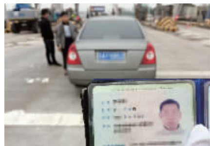
交警查处无证驾驶现场

快报讯(通讯员 胡正金 记者 王瑞)还在考驾照,就敢开车上高速?10月24日上午,南京交警高速四大队在开展交通违法集中整治工作中,连续查获两名无证驾驶人员,目前两人所驾驶车辆均被暂扣。