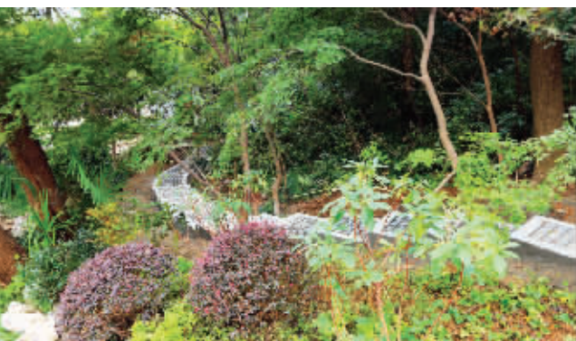
新建的游步道