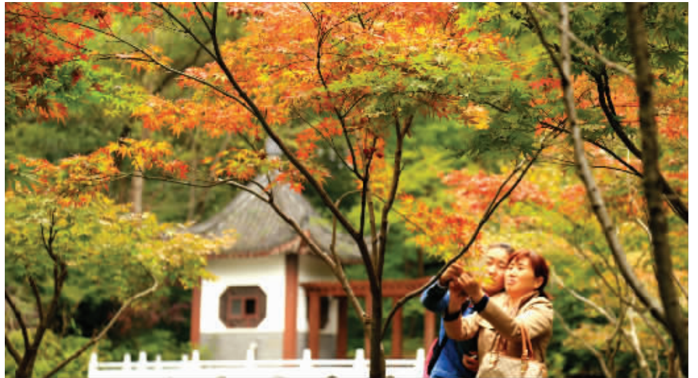
栖霞山已到赏枫时节

通过游步道，游客还能与自然更亲近。据介绍，今年栖霞山还引用自然水体，通过整治环境道路、栽种水生植物、树立标志牌垃圾桶等，对天鹤幽、饮马池、小桃园、半馆附近4处水体进行了升级改造。据景区工作人员介绍，这些不仅是景点，同时也是秋冬森林防火的天然蓄水池。