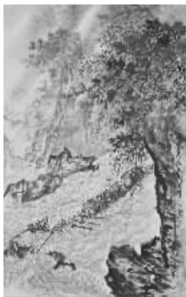
吴一峰《大渡河放筏》