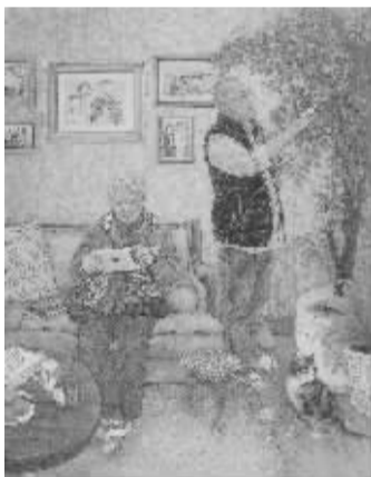
向洋《时间都去哪儿了》