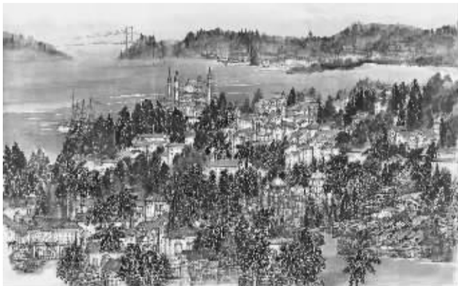
卢贞《丝路绵远博峡端》

然而,四川在西南地域,又自有其绝不同于沿海江浙的人文环境与自然环境。所谓“桔生淮南则为桔,生于淮北则为枳。所以然者何?水土异也”。独特的一方水土培育出文化艺术独特的风貌。当年南京的傅抱石有感于四川的丰茂林木而创散锋皴法,黄宾虹青城观夜山而强化点子积墨浑厚华滋,陆俨少乘木筏过三峡,而有其云水颤掣之别致勾勒……故傅抱石有人川画不出好画,对不起四川山水之说。傅抱石一生最好的作品,大多也是在四川所作。至于四川的张大千,虽早年离川于江浙京城乃至世