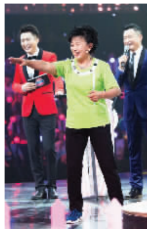
节目现场的朱明瑛

举开启一段“歌声传奇”,不仅邀请到流行音乐制作人——黄国伦以及她的妻子、著名主持人寇乃馨。甚至还邀请到著名歌唱家、歌舞艺术家、国家一级演员朱明瑛老师和她的儿子、爱徒前来倾情加盟。