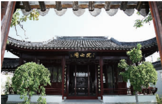
怀海义庄一院士阁