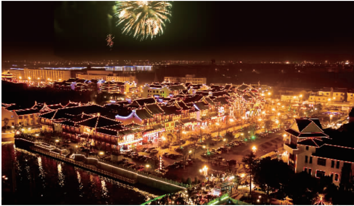
正月初九焰火晚会