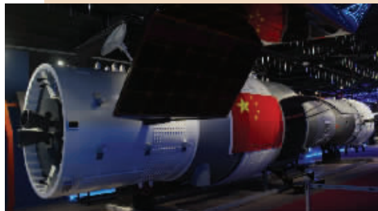
“遨天一号”太空科技体验馆