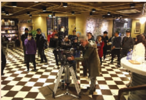
杜可风在园区内的“江苏最美书店”进行拍摄