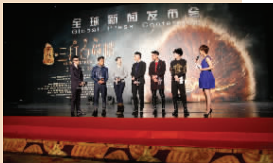
《三打白骨精》剧组在锡举行全球发布会