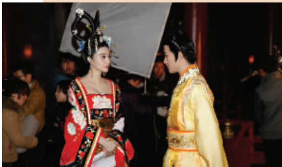
范冰冰和李治廷在园区影棚拍摄《武媚娘传奇》

作为一座传统的工商业城市，无锡正在向科技之城、文化之城、生态文明之城转型。在滨湖区，“咱们工人有力量”已经成为过去式，“华莱坞”这样的新兴产业使文化成为新的驱动力和增长极，园区门口由电影海报拼成的招贴画上写着这样一句话：“电影让城市更时尚”，这里发生的巨变告诉人们，一个产业可以改变一座城市的气质。 匡笠