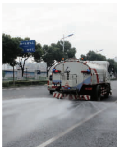
环卫作业方式更科学

为给广大市民营造清洁、舒适的生活环境,锡山城管加强环卫保洁工作,打造城区环境新景象。