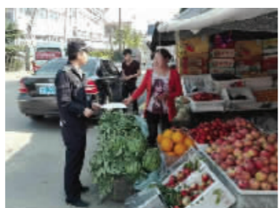
开展农贸市场周边市容环境秩序整治行动