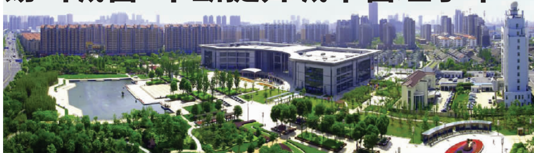
馨和园鸟瞰图

锡山城管自建局以来14年风雨兼程,始终不忘初心、砥砺前行,通过多渠道倾听民声,多角度体察民情,多手段排解民忧,多举措研究措施,不断提高城市管理水平。今年以来,以创建江苏省优秀管理城市工作为契机,锡山城管增强做好城市管理工作的主动性和积极性,认真及时解决群众反映强烈的城市环境问题,加快推进城市设施配套,持续优化城市管理机制,带动了锡山整体环境面貌和形象品位的提升。