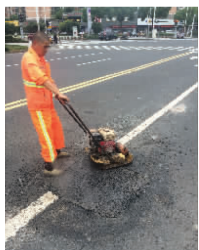
对沥青路面裂缝和坑洞进行修补

抢在梅雨季节前,锡山城管在前期排查的基础上,对东亭城区管辖区段沥青路面裂缝和坑洞进行了修补,完成华夏