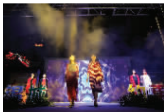
深度整合全区商业、人文和旅游资源,带动商气和人流的回归