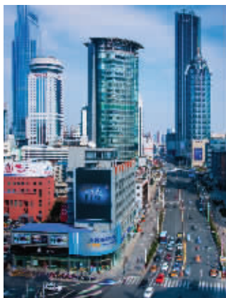
梁溪区消费市场繁荣,集聚了一批一线品牌,形成了高端商品消费圈。

一核,即解放环路以内核心商务区;一带,即古运河旅游风光带;一轴,即以中山路为主轴,串联优化太湖广场片区、火车站片区、吴桥片区等商圈;五园区,即食品科技园、城北生产性服务业园、扬名传感信息园、山北光电材料园、广益家居园;五街区,即惠山古镇、崇安寺、南禅寺、南长街、小娄巷等文化街区。