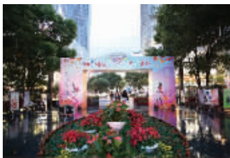
促进文商旅融合发展,梁溪区举办“品质梁溪”系列主题活动

在未来,市民或游客在梁溪区核心商圈会享受到更多智慧体验。梁溪区商务局相关负责人介绍,梁溪区将着力构建城市智慧商圈,通过网络信息技术应用和基础设施改造升级,积极探索和构建线上线下互动的体验式智慧商圈,打造以解放环路商业中心为试点的智慧梁溪商圈。开发城市生活服务APP,实现城市智能交通引导、停车指示、客流疏导、信息推送、移动支付、消费互动、物流配送等生活服务功能的全覆盖,以技术创新的应用,实现城市商业发展的智能化。