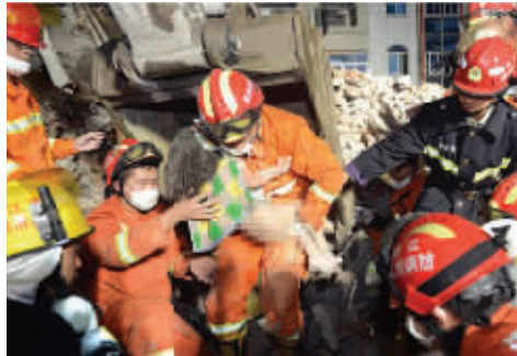
一名小女孩获救