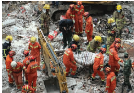
抬出一名被埋者